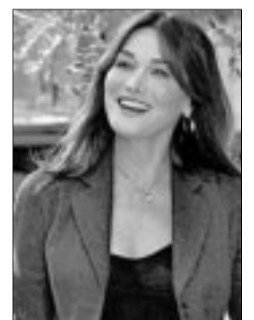
Carla Bruni.

La primera dama de Francia, Carla Bruni, se confiesa simpatizante de la izquierda y asegura que no tiene “ninguna influencia política” sobre su marido, el conservador Nicolas Sarkozy. “¿Cómo se puede imaginar que mi marido se haya convertido en un bendito muñequito que se deja influir? En una pareja, cada uno tiene una influencia personal sobre el otro, pero no tengo ninguna influencia política sobre mi marido. ¡Afortunadamente, si no sería un infierno!”, señala en una entrevista para la revista “Elle”.